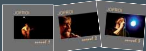
Survols 1 / 2 / 3 compilations des 6 premiers LP