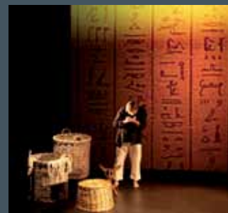
BIENVENUE SUR LA TERRE spectacle musical de 6 à 96 ans tout public ou scolaire avec Line Adam