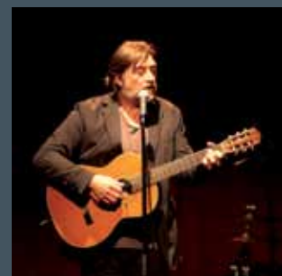
SOLITAIRE le récital solo guitare pour petits lieux