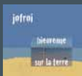
Bienvenue sur la terre