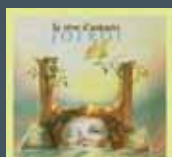
Le rêve d'Antonin Les aventures du petit Sachem

Les plus belles chansons de Jofroi pour les enfants vol 1 et 2 L'homme au parapluie Histoires à dormir debout Marchand d'histoires Le jour où les poules auront des dents Grenadine Blues Jofroi raconte Pierre et le loup