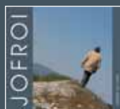
Cabiac sur terre