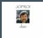
Duo - double CD en public