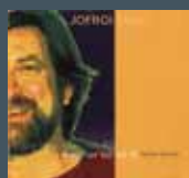
Marcher sur un fil