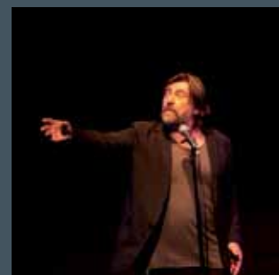
JOFROI EN CONCERT 2 formules : avec quatre musiciens avec deux musiciens

Sortie en été 2011 du nouvel album de chansons cabiac sur terre et création du nouveau spectacle pour célébrer ses quarante ans de cheminement dans la chanson.